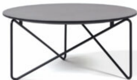
Table basse POLYGON de Prostoria

Les trois tables sont basées sur la même origine formelle que le fauteuil Polygon. La forme triangulaire dominante est accentuée lorsqu'elle est vue de côté, mais dès que l'observateur commence à bouger, les trois triangles de la base se chevauchent pour former des dessins complexes en trois dimensions. La hauteur et la surface des plateaux de table sont contrebalancées, ce qui entraîne une différence radicale d'inclinaison des lignes diagonales des barres d'acier. La table basse Polygon est disponible en deux nouvelles tailles. Table basse de 84 cm de diamètre et plus haute de 60 cm de diamètre. Le plateau de table est disponible en bois massif, en MDF avec Fenix, ou en HPL, adapté à une utilisation extérieure. La construction de tiges de métal pliées en forme de console constitue un mariage idéal avec une typologie moderniste du fauteuil Polygon.